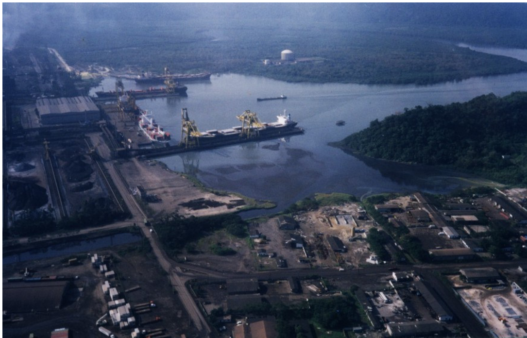
Figura 3 – Detalhe da bacia de evolução do porto da COSIPA e Ultrafertil (atual Fosfertil), assoreada por sedimentos contaminados por diversos poluentes, entre os quais: metais pesados, benzo(a)pireno, bifenilas-policloradas (PCBs), dioxinas e furanos.