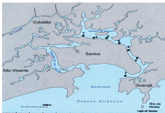
Figura 1 - Localização dos pontos de amostragem da Avaliação Complementar do material a ser dragado pela CODESP-(CETESB, 1998).

OBS: Este estudo revelou que a poluição se disseminou ao longo do canal do estuário e, que os locais liberados pela CETESB necessitavam ser revistos na busca de uma nova alternativa de disposição, face aos seguintes motivos: